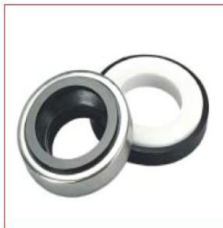
TIPO AR1 Equivalente VAZEL AR, BURGMANN AR ROTEN 37B