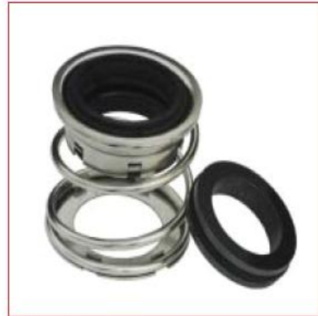
TIPO 12 Equivalente a JOHN CRANE TIPO 12